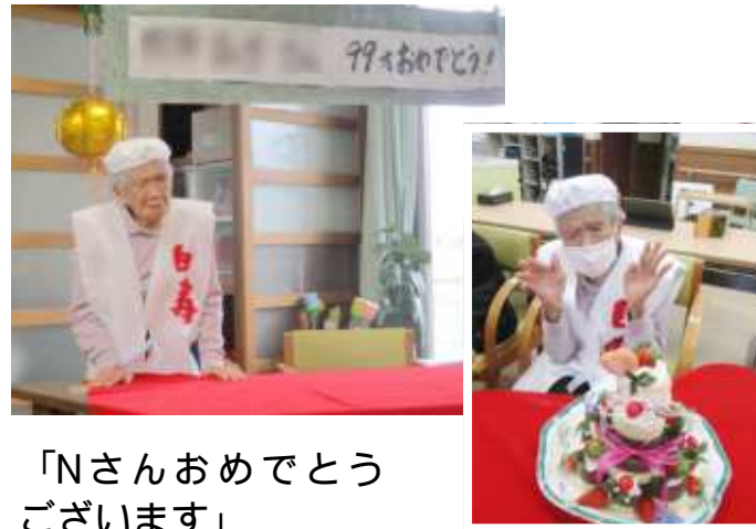
「Nさんおめでとうございます」

当日Nさんも喜んでくださり、「これからも元気にかつらぎへ寄せてもらいます」と力強いお言葉をいただきました。